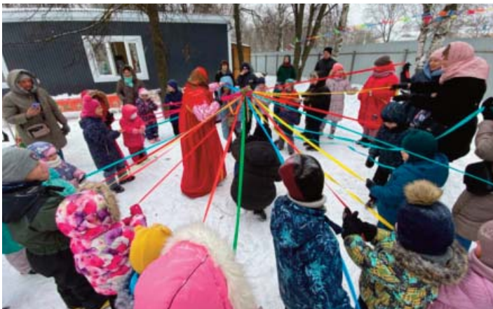
Дети и взрослые гости праздника во время игры