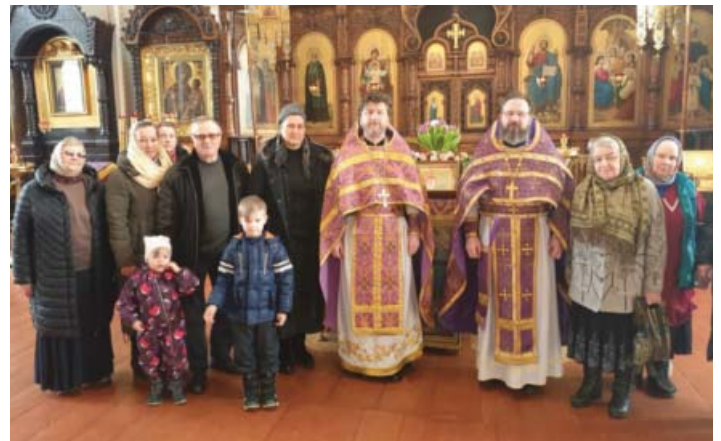
Фото на память после праздничного молебна