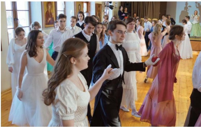
Юноши и девушки – участники Сретенского бала

18 февраля в православной школе «Рождество» состоялся Сретенский бал старшеклассников. На бал были приглашены юноши и девушки из четырёх дружественных школ – гимназии «София» из Клина, школы «Образ» из Малаховки, гимназии святителя Филарета Московского из Лобни и Рождественской школы. Более трёх часов старинные танцевальные ритмы – вальсы, марши, кадрили, котильоны – перемежались бальными играми, литературными загадками и сольными выступлениями.