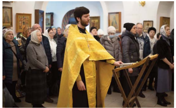
Паломники на литургии в Никольском храме