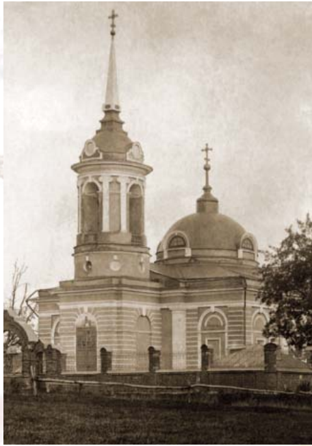
Храм Рождества Христова. Начало XX века

холмистом рельефе английский парк, где на обрыве глубокого оврага был сооружён романтический грот в итальянском стиле. Сыновья графа Кутайсова – Павел и Александр – продолжили службу в Петербурге, верно служили царю и Отечеству.