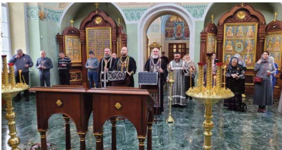
Чтение канона Андрея Критского в Никольском храме села Мансурово

ной Марии Египетской (палестинской подвижницы, жившей в первой половине VI века), которое мы слышим на утрене. Вместе с Великим покаянным канонем преподобного Андрея, житие Марии составляет «ядро» этого уникального богослужения, которое по своей продолжительности